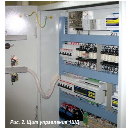
Рис. 2. Щит управления 1ЩД