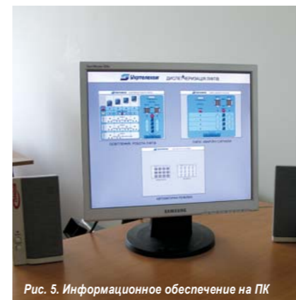
Рис. 5. Информационное обеспечение на ПК

Как видно из схемы, система мониторинга является распределенной и состоит из четырех щитов (Щит 1ЩД ... Щит 4ЩД). В каждом щите находятся модули распределенного управления серии S7000, соединяемые в сеть посредством интерфейса RS-485; кроме того, в щитах находятся промежуточные реле для управления силовым оборудованием. С информацией о характеристиках модулей S7000 читатель может ознакомиться на сайте www.neurosys.com.ua .