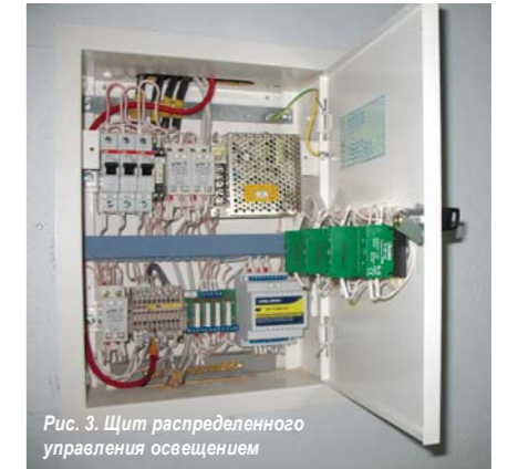
Рис. 3. Щит распределенного управления освещением

При выборе информационного обеспечения (ИО) верхнего уровня предпочтение разработчиков было отдано SCADA-системе