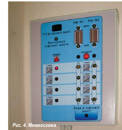
Рис. 4. Мнемосхема